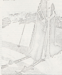
Miss-verkiezingen geven in de beginjaren zestig geen aanleiding tot ergernis. Tien jaar later werden ze door feministen vernamelijk genoemd.